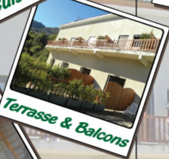
Terrasse & Balcons