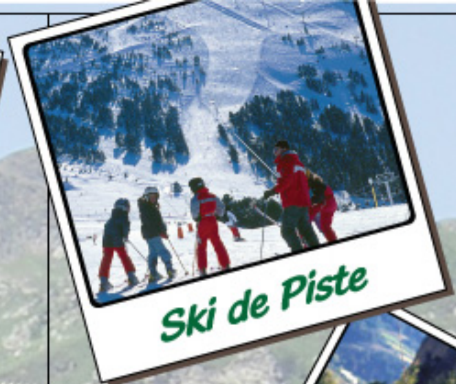
Ski de Piste