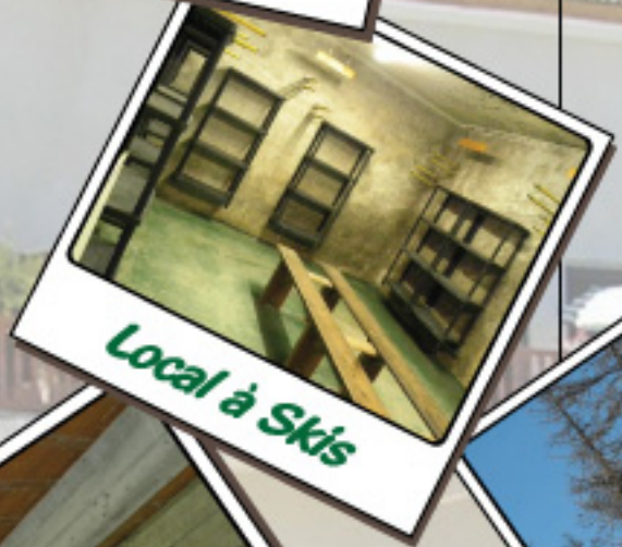
Local à Skis